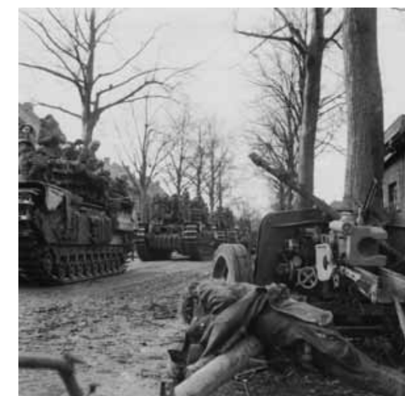
De slag om de kruising van de Rijksweg bij Pey in voorbij en troepen verzamelen zich voor de opmars naar het volgende dorp.

de rand van Koningsbosch. Gehinderd door zware sneeuwval zoeken ze onmiddellijk beschutting in het bos. Wat de Schotten niet weten is dat op een slechts honderden meters afstand een paar honderd Duitse soldaten in schuilplaatsen en houten bunkers bivakkeert. Nadat een Schotse patrouille gevangen wordt genomen ontruimen de Duitsers in allerijl hun posities in het bos. Bij het aanbreken van de nieuwe dag op 19 januari arriveert uiteindelijk de rest van het Schotse bataljon. Ondanks dat het nog steeds sneeuwt wordt de aanval op de vijand in het dorp ingezet. De aanval verloopt voorspoedig ondanks dat de Duitse infanterie steun krijgt van Tiger tanks en SturmGeschütze. In de nacht van 19 op 20 januari wordt contact gemaakt tussen het bataljon dat zich in Koningsbosch bevindt en een vooruitgeschoven bataljon dat het dorp inmiddels vanuit zuidelijke richting via Höngen had bereikt.