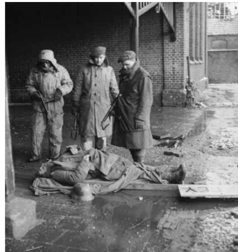
Britse soldaten bij een gesneuvelde Duitser na de verovering van de kruising bij Pey, 19 januari 1945.

Door de slechte toestand van de wegen lopen verschillende tanks in het donker vast en minstens drie Sherman tanks worden door vijandelijk vuur uitgeschakeld. Twee compagnieën bereiken laat in de avond de bossen aan