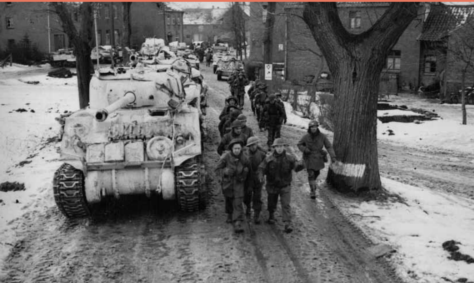
Soldaten van de Lowland Divisie en Sherman tanks van de 8ste Britse pantserbrigade op de strategisch belangrijke weg door Hongen, 20 januari 1945.