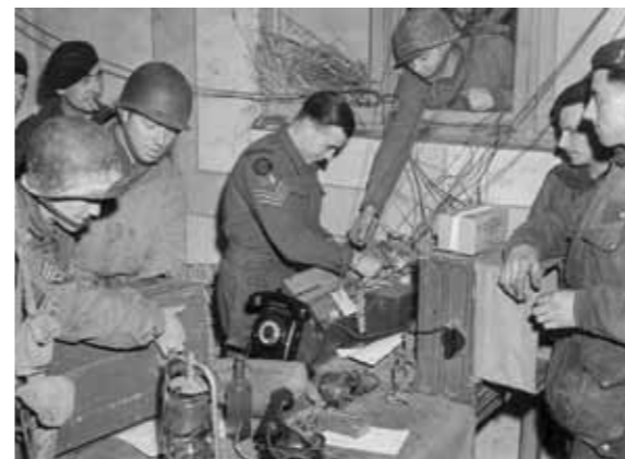
Wisseling van de wacht: soldaten van de Amerikaanse 8ste Pantserdivisie nemen op 19 februari 1945 de posities van de Britse commando's bij Linne over.

Begin februari 1945 staan de geallieerde troepen paraat om de aanval in een tangbeweging op het gebied tussen Roer en Rijn in te zetten. In de omgeving van Nijmegen staan het Canadese 1 ste leger klaar om Operatie Veritable, de noordelijke helft van de tangbeweging uit te voeren. Langs de Roer staat het 9 de Amerikaanse leger klaar om operatie Grenade uit te voeren, de zuidelijke helft van de tangbeweging. Operatie Veritable start zoals gepland