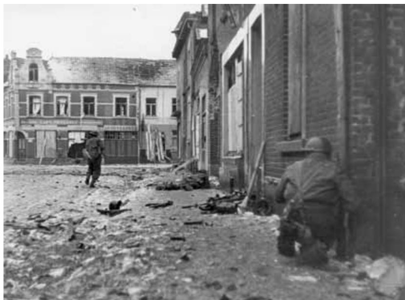
Straatgevechten in de kern van Echt, 18 januari 1945.

heeft al die tijd de vertraging van de Desert Rats op de linkerflank met argusogen gevolgd. Volgens plan moet een van zijn brigades namelijk via de kruising bij Pey naar Koningsbosch en vervolgens Höngen oprukken. Op 17 januari besluit hij echter niet langer te wachten op steun uit noordelijke richting. Zijn tweede brigade is al dagen in paraatheid voor de aanval en langer uitstel is niet wenselijk. In de vroege ochtend van 18 januari wordt bij de Duitse dorpjes Lind en Stein een doorbraak geforceerd. De verliezen aan