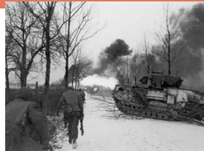
Sint Joost, 20 januari 1945. Britse soldaten en een Crocodile tank in actie op de toegangsweg naar het dorp.

Het is laat in de middag van 21 januari als het de Britten dan eindelijk lukt om de overhand in de gevechten te krijgen. Veel van de para's hebben zich in de huizen verschanst. Bang voor represailles van de Engelsen, komen ze pas onder dekking van de inwoners tevoorschijn wanneer die hun schuilkelders verlaten. Meer dan honderd Duitse para's worden tijdens de slag krijgsgevangen gemaakt of blijven dood achter in en tussen de huizen. De resterende para's is het echter gelukt om zich in de richting van Linne en Montfort terug te trekken om daar nieuwe stellingen in te nemen. De kameraden die naar de