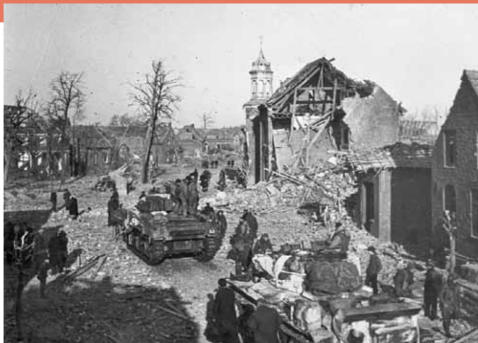
Een blik op door het geallieerde bombardement zwaar getroffen Montfort.

Parallel aan de aanval op Montfort houden de commando's langs het Julianakanaal gelijke tred met de Desert Rats. Op 23 januari trekken de commando's vanuit Echt op naar Maasbracht en Linne. Een paar dagen eerder was de 1 ste Commando Brigade de Maas en het kanaal overgestoken om posities ten noorden van Echt in te nemen. In Maasbracht wordt weinig weerstand ondervonden, maar net buiten het dorp komt het leidende bataljon - No.45 Royal Marines Comman-