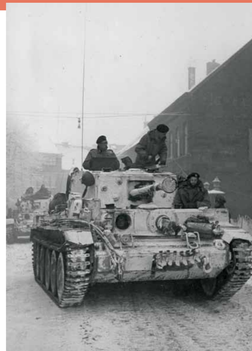
Figuur 3. Tanks van het 5th Royal Tank Regiment van de Desert Rats in Sittard, 15 januari 1945.

Begin januari 1945 worden de Britse eenheden dicht bij het front samengetrokken en Sittard en de omliggende dorpen worden overspoeld met troepen en materieel. Het is aan generaal Lyne van de 7 de pantserdivisie om de eerste zetten van het plan uit te voeren. In de vroege ochtend van 13 januari gaat operatie Blackcock van start met zware artilleriebeschietingen op de Duitse stellingen ten zuiden van Susteren. De Britse kanonnen vuren over een afstand van meer dan 10 kilometer op de Duitse stellingen in en rond Susteren en Dieteren. Inmiddels hebben de tankregimenten van de 7 de divisie een lange colonne gevormd op de Rijksweg in Sittard. Deze weg vormt