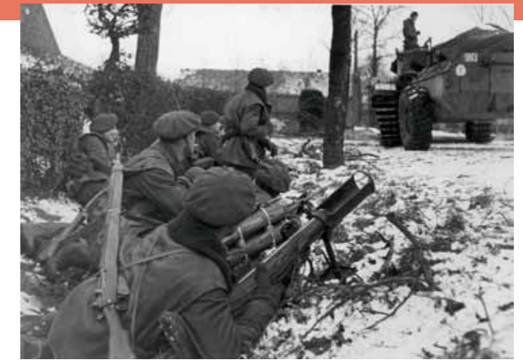
Soldaten van het bataljon Rifles Brigades en een Crocodile tank nabij Sint Joost, 20 januari 1945.

Sinds het begin van de evacuatie van frontdorpen in de Roerdriehoek is het aantal vluchtelingen in Montfort fors gestegen. Het typische boerendorp heeft nog niet te kampen met voedseltekorten waardoor veel vluchtelingen uit Susteren en Echt hier onderdak zoeken. Begin januari 1945 is in elk huis wel één of twee vluchtelinggezinnen ondergebracht. Er zijn dan meer dan 4000 mensen in het dorp dat normaal 1700 inwoners telt. Tussen 19 en 23 januari komt Montfort diverse malen onder artillerievuur te liggen en wordt tot tweemaal toe door Typhoon jachtvliegtuigen van de Canadese luchtmacht gebombardeerd. Op 21 en 22 januari worden meer dan 100 bommen in en rond het dorp afgeworpen. Hierbij raken een groot aantal van de huizen in het dorp geheel of gedeeltelijk beschadigd. Van enkele huizen blijft niet meer over dan een ruïne. In het vlakbij gelegen Sint Joost wordt nog volop gevochten als Montfort op 21 januari door twee eskadrons wordt gebombardeerd. Sinds het begin van de operatie is dit de eerste dag dat luchtsteun mogelijk is. En die wordt dan ook direct ge-