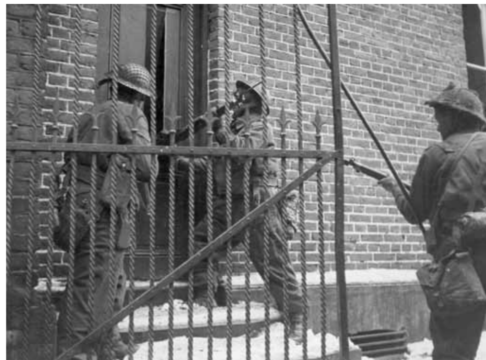
Huis aan huis gevechten in Echt, 18 januari 1945

van Sherman tanks van de Dragoon Guards van het Britse 8 ste pantserbrigade met zijn opmars richting Koningsbosch. Niet zoals gepland via de kruising bij Pey maar via het venachtig gebied tussen Pey en Koningsbosch.