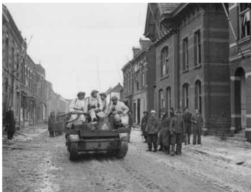
Britse brencarrier in de straten van Echt nadat het dorp op 18 januari is bevrijd. Rechts een groepje Duitse krijgsgevangenen.

In de namiddag van 18 januari start een eerste Schotse bataljon met steun