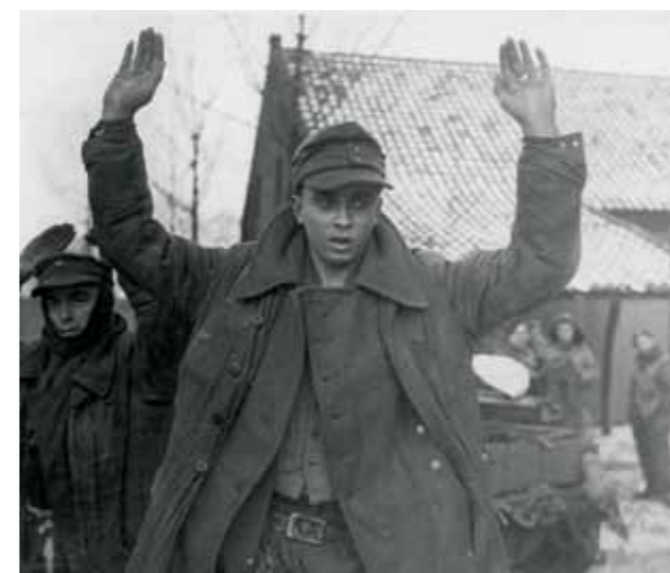
Sint Joost, 21 januari 1945. Gevangen genomen Fallschirmjäger. De soldaten van Kampfgruppe Hübner waren weliswaar veelal jong en onervaren, maar behoorlijk strijdlustig.

Inmiddels had de Lowland divisie in de nacht van 21 januari vanuit Koningbosch het Duitse grensplaatsje Waldfeucht bereikt. Het verlaten dorp wordt eenvoudig ingenomen. Maar in de vroege ochtend wordt een tegenaanval door Duitse infanterie ingezet, ondersteund door een zestal gevreesde Tiger tanks van het 301 e zware tankbataljon en een tiental SturmGeschütze. Het effect van de Duitse aanval wordt snel duidelijk als een aantal Sherman tanks van de 8 ste pantserbrigade kansloos worden uitgeschakeld door de Tigers. In Waldfeucht wordt gedurende de hele dag zwaar gevochten waarbij een groot aantal huizen in puin wor-